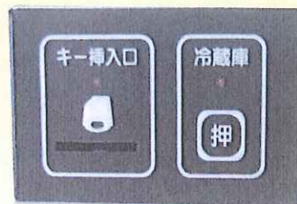
節電機能付き鍵装置 寸法: 88 (W) X56 (H) X150 (D) mm 重量: 約1Kg